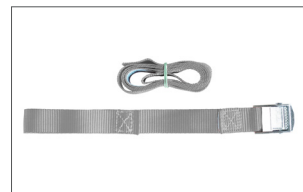
Zurrurt 1722G 100 mm lang mit Gurtklemme