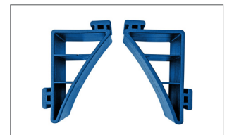
Haltehörner 1722H Für runde Güter