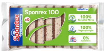
Sponrex 100 95000116