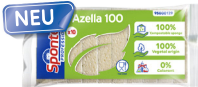
Azella 100 95000129