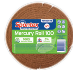
Mercury Roll 100 95020048

Zusammensetzung: Synthetische Recyclingfasern, abrasive Füllstoffe aus Aluminium und Walnusschale, Latex