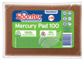
Mercury Pad 100 95020047

Zusammensetzung: Schwamm: Salze, Wasser, Zellulose. Scheuerteil: Synthetische Recyclingfasern, abrasive Füllstoffe aus Aluminium und Walnusschale, Latex